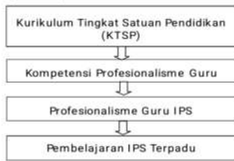
Bagan 1. Alur Pembelajaran IPS Terpadu

KTSP adalah kurikulum operasional yang disusun dan dilaksanakan oleh satuan pendidikan dengan memperhatikan dasar yang dikembangkan oleh Badan Standar Nasional Pendidikan (BSNP). KTSP merupakan paradigma baru pengembangan kurikulum yang memberikan otonomi luas kepada setiap satuan pendidikan dan pelibatan masyarakat dalam rangka mengefektifkan proses belajar mengajar disekolah. Terkait dengan pembelajaran IPS, KTSP menuntut pembelajaran Terpadu, sehingga tidak adalagi guru Sejarah, guru Geografi, dan guru Ekonomi,namun adanya guru IPS.